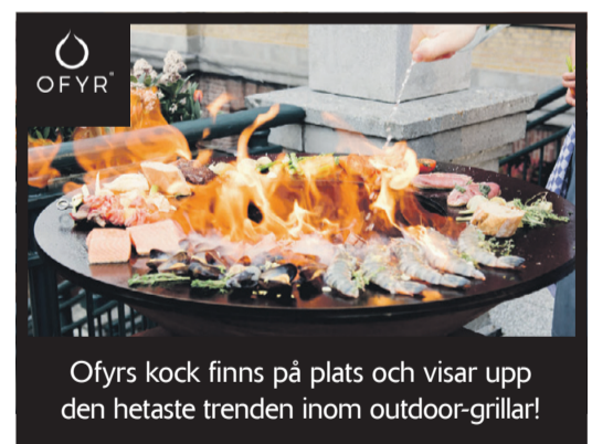
Ofyrs kock finns på plats och visar upp den hetaste trenden inom outdoor-grillar!