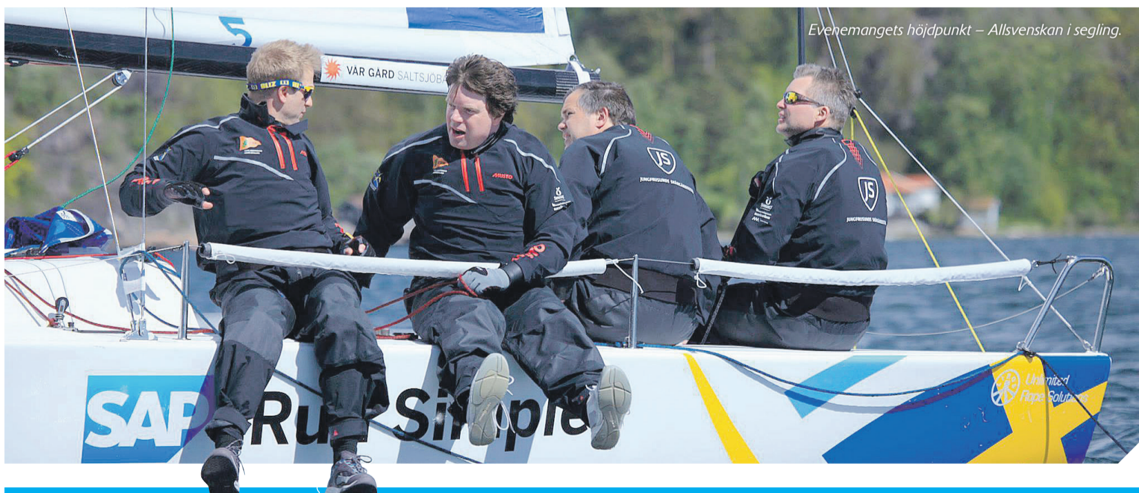
Evenemangets höjdpunkt – Allsvenskan i segling.